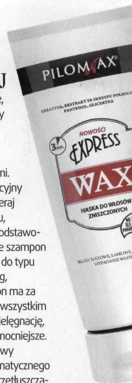
Maska odżywcza do włosów zniszczonych Wax Express (Pilomax, 200 g, 32,90 zł).

Pielęgnację włosów traktuj równie poważnie, jak pielęgnację skóry. Na gładkiej cerze każdy makijaż wygląda świetnie. Tak samo będzie wyglądała dowolna fryzura wykonana na zdrowych włosach. Przede wszystkim nie eksperymentuj wciąż z nowymi kosmetykami. Idealnie, jeśli mogłabyś ustalić plan pielęgnacyjny z dobrym stylistą. Szampon do włosów dobieraj równie uważnie jak kosmetyk do demakijażu, a odżywkę i maskę – jak krem do twarzy. „Podstawowa zasada w pielęgnacji włosów jest taka, że szampon dobieramy do typu skóry głowy, a odżywkę do typu włosów” – mówi Izabela Szymczak, trycholog, właścicielka Kliniki Włosów Hair Lab. Szampon ma za zadanie nie tylko oczyścić włosy, ale przede wszystkim skórę głowy. Właśnie od niej warto zacząć pielęgnację, dzięki temu nowo wyrastające włosy będą mocniejsze. Ponieważ często farbujemy włosy, skóra głowy zazwyczaj jest przesuszona. Wymaga systematycznego nawilżania, nawet jeśli masz tendencję do przetłuszczania się włosów. Dlatego warto sięgać po delikatne szampony nawilżające. Raz w tygodniu zrób peeling skóry głowy – ona również wymaga złuszczenia. Dzięki temu zabiegowi nie tylko usuniesz zanieczyszczenia, ale też warstwę sebum, która może blokować dostęp tlenu do mieszków włosowych i w rezultacie sprawiać, że nowe włosy będą wyrastały słabsze.